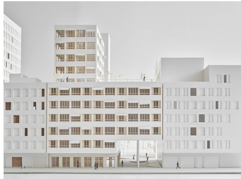
VIVIENDA SANT ANDREU, BARCELONA