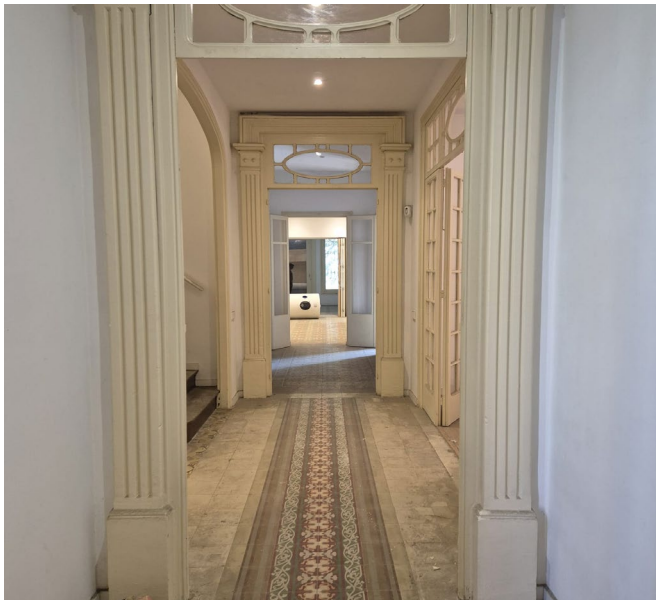
VIVIENDA RESIDENCIA, BADALONA